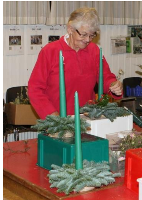
Arkivfoto: Start på juledekorationer