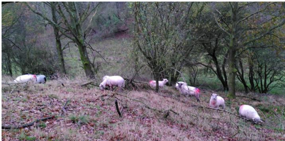
Farvestrålende får nyder livet på det rekreative område sammen med vædder Gorm.