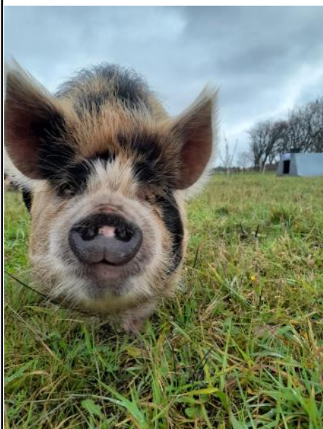
Gala og Bintje!