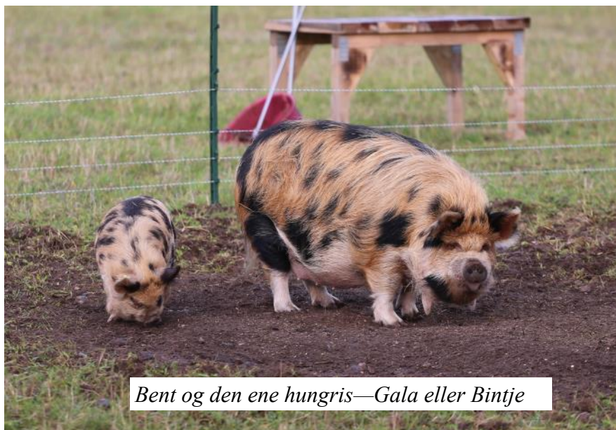
Bent og den ene hungris—Gala eller Bintje