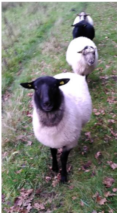
Fire unge gimmere fra i år går nede i 'spidsen' og skal ikke have lam næste år – avlsudvalget vurderede at de var for unge.