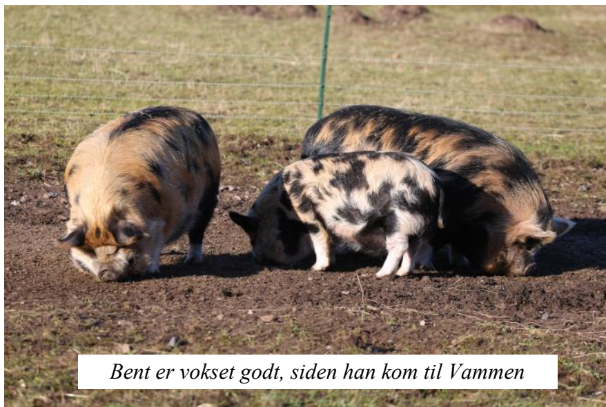
Bent er vokset godt, siden han kom til Vammen