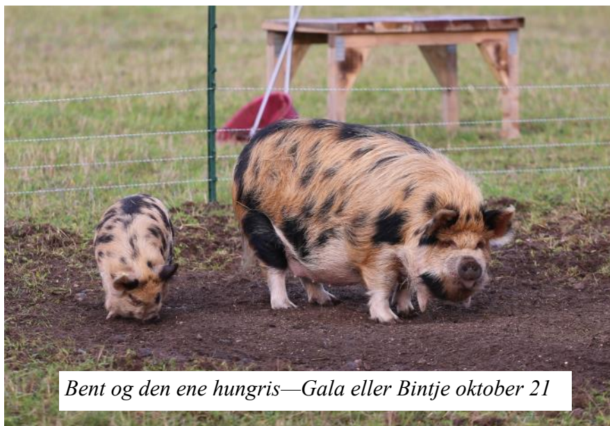
Bent og den ene hungris—Gala eller Bintje oktober 21